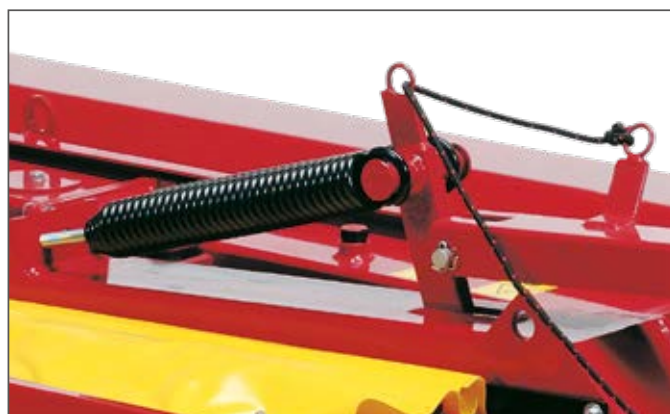
Sospensione centrale / Central dumper