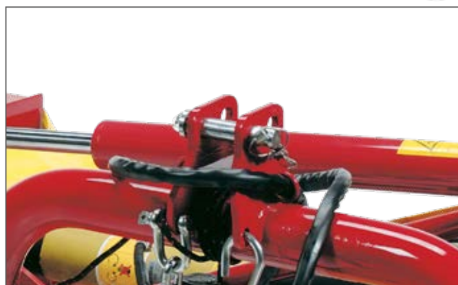
Dispositivo di sicurezza in caso di urti / Safety device in case of collisions